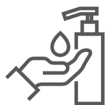
Mantener la higiene adecuada y frecuente de manos