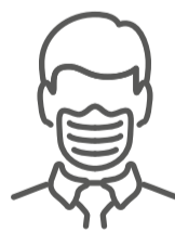
Uso adecuado del barbijo en espacios interiores, incluyendo los ámbitos laborales, educativos, sociales y el transporte público