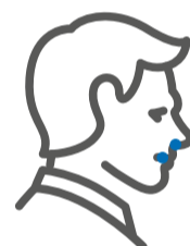
Pérdida del gusto u olfato